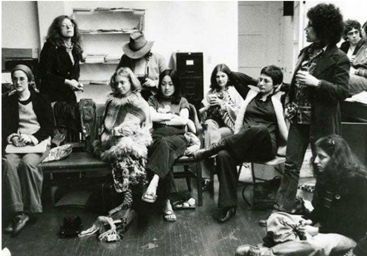
Fotoğraf 3: Judy Chicago ve öğrencileri feminist stüdyo atölyesinde derste, 1973 - Fotoğraf Maria Karras.

tespitiyle sanatın da konusu haline gelmeye başladı. Feminizmin ikinci dalgasının en önemli yol göstericilerinden “kişisel olan politiktir” vurgusu ve “bilinç yükseltme” pratikleriyle kadınlar toplum tarafından konuşulması yasaklanmış her türlü konuyu (aile içi şiddet, cinsel haz alma tercihleri gibi) birbirleriyle paylaşmaya başladılar. Farkındalık yaratmaya yönelik bu pratik, hem toplumsal cinsiyet eşitsizliği mücadelesinde kadınların bilinçlenmesi hem de kadınların yalnız olmadıklarını hissettirmesi açısından önemliydi. Feminizmin beden, cinsellik ve özel alan tartışmaları üzerinden sürdürdüğü mücadele hâlâ bitmiş değil, dolayısıyla feminist sanatçılar bugün de feminist teoriyle paralel olarak bu meseleleri sanatlarına yansıtmaya, sanatlarını bu mücadeleyi yansıtacak şekilde üretmeye devam ediyorlar.