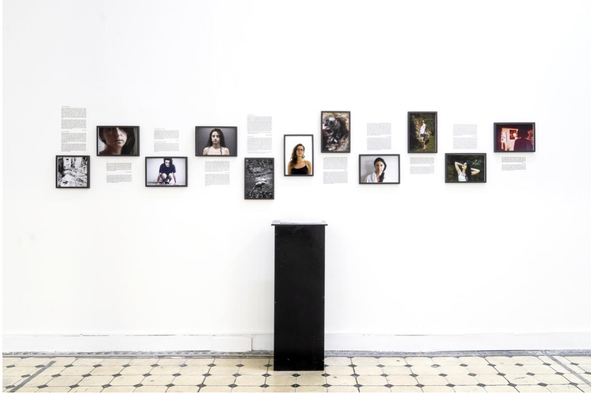
Fotoğraf 10: "Git Üstüne Bir Şey Giy" sergi görseli