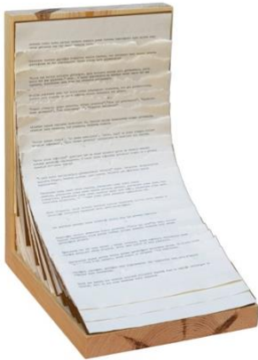
Fotoğraf 7: Günseli Baki, Hiç kimsenin hikayesi ya da herkesin herkesi (2020) - teksir kağıdı üzerine metin kolajı, ahşap üzerine yerleştirme

“Git Üstüne Bir Şey!” çalışması, bir grup sanatçı arkadaşımınla feminist sanat ve fotoğrafta temsil üzerine kendi aramızda düzenlediğimiz atölyeler sırasında, 2016 yılında Şehlem Kaçar’ın “Terapötik Fotoğraf ve Otoportreler” atölyesinde başladı. Kavramsal çerçevesini oluşturduğum çalışma için ürettiğim bazı fotoğrafları atölyeye katılan diğer sanatçı arkadaşlarımla paylaşarak onlara da aynı soruları sordum: “Bedeninize dair size yapılan ilk ikaz neydi?” Herkes çocukluk yıllarında bedenleri hakkında yapılan uyarıları hatırlamaya ve içini dökmeye başlamıştı. İçimizden dökülenler bütün odayı doldurmuş, bu uyarıların günlük hayatımızdaki davranışlarımızı nasıl etkilediğini, bunları nasıl içselleştirdiğimizi saatlerce konuşmuştuk. O gün kendiliğinden oluşan bu “içini dökme hali” çalışmanın “Hatırlama” bölümünü oluşturdu. Çalışmaya katılan on sanatçı arkadaşım Dilara Kızıldağ, Gülnaz Bingöl, Hale Güzin Kızılaslan, Meryem Güldürdak, Nesrin Ermiş, Nurgül Öz, Serra Akcan, Sinem Parlak, Sezgi Abalı ve Şehlem Kaçar serginin bu bölümü için kendi metinlerini yazdılar ve metinlere karşılık gelen imgeleri ürettiler. Metinleri ilk okuduğumda birçok farklı hatırlama kaydının yanı sıra, benzer güçlendirici cümlelerle karşılaştım. Metinlerden alıntıladığım bazı cümlelerle yeni bir metin kolajı oluşturarak “hiç kimsenin hikâyesi ya da herkesin hikâyesi” adıyla sergiye yerleştirdim.