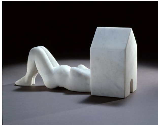
Fotoğraf 2: Louise Bourgeois (1994), ‘Kadın-Ev’ (Femme-Maison), Londra, İngiltere: Wendy Fisher Koleksiyonu

1960’lı yılların sonlarında feminist sanatçılar, Bourgeois’ın eserlerinde işlediği kişisel deneyim, kadının toplumdaki konumu ve kadın bedeni gibi temaları genişletti. Feminist sanat akımı altında bir araya gelen bu sanatçılar, toplumsal cinsiyet eşitsizliği mücadelesini sanatlarının bağlamı haline getirdiler. Toplumsal cinsiyetle ilgili temalar, özellikle Simone de Beauvoir’ın (1993a, 1993b, 2010) “İkinci Cins” kitabında yer alan kadınlığın bir inşa olduğu