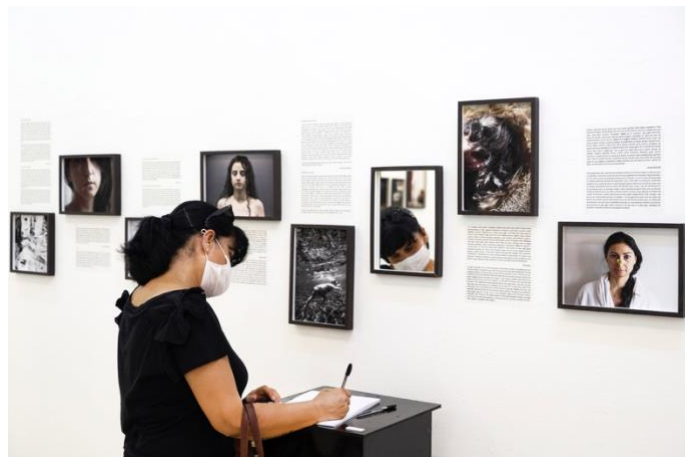
Fotoğraf 8: "Git Üstüne Bir Şey Giy" sergi görseli